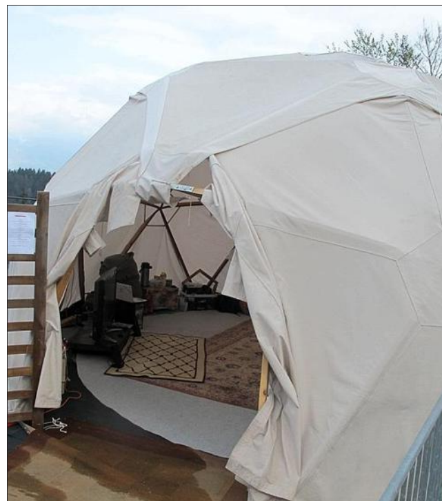
Outre les traditionnels stands pour s'informer des dernières innovations, le public est invité à découvrir le géodôme servant à la tenue des différentes conférences.